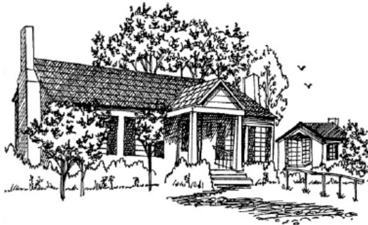
KELLER HOME IN TUSCUMBIA

هلن اولین دختر این خانواده بود که با تولدش، شادی را برای خانه به ارمغان آورد. مادر هلن خوشحال بود و مدام هلن را ناز و نوازش می‌کرد. هلن چشم و چراغ و عزیزترین فرد مادرش شد. پدر هلن نیز به او عشق می‌روزید. هلن در مورد سال‌های اولیه زندگی‌اش مطالبی را نوشته است. او در مورد این سال‌ها، چنین توصیفی را بیان می‌کند: «آغاز زندگی من ساده و تقریباً مانند زندگی هر فرد دیگری بود، من آمدم، دیدم، شنیدم و به دستاوردهایی در زندگی‌ام رسیدم، همانطور که هر کودکی چنین کاری را می‌کند.»